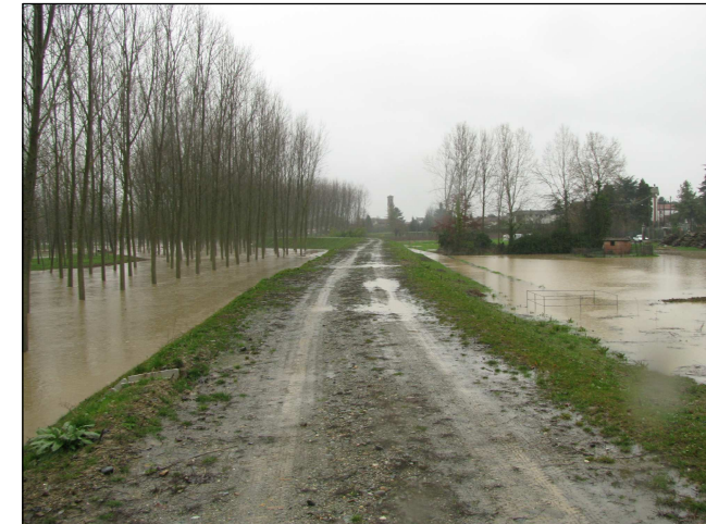
realizzazione attraversamento SP nel 2014